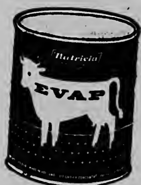
E MIHOR LECHI EVAPORADA

"PAGINAS" obtenible na UNION STORE Mainstreet - San Nicolas